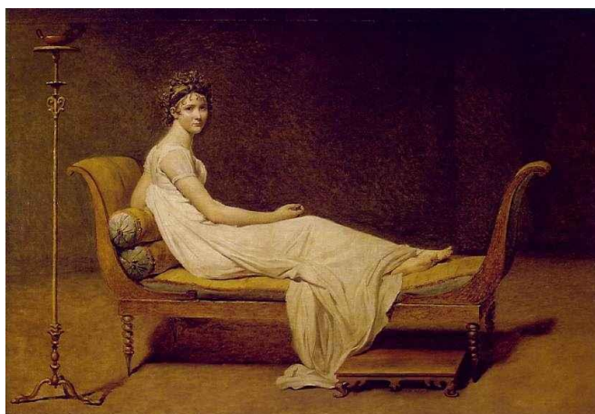
Jacques-Louis David, Portret pani Recamier, 1800