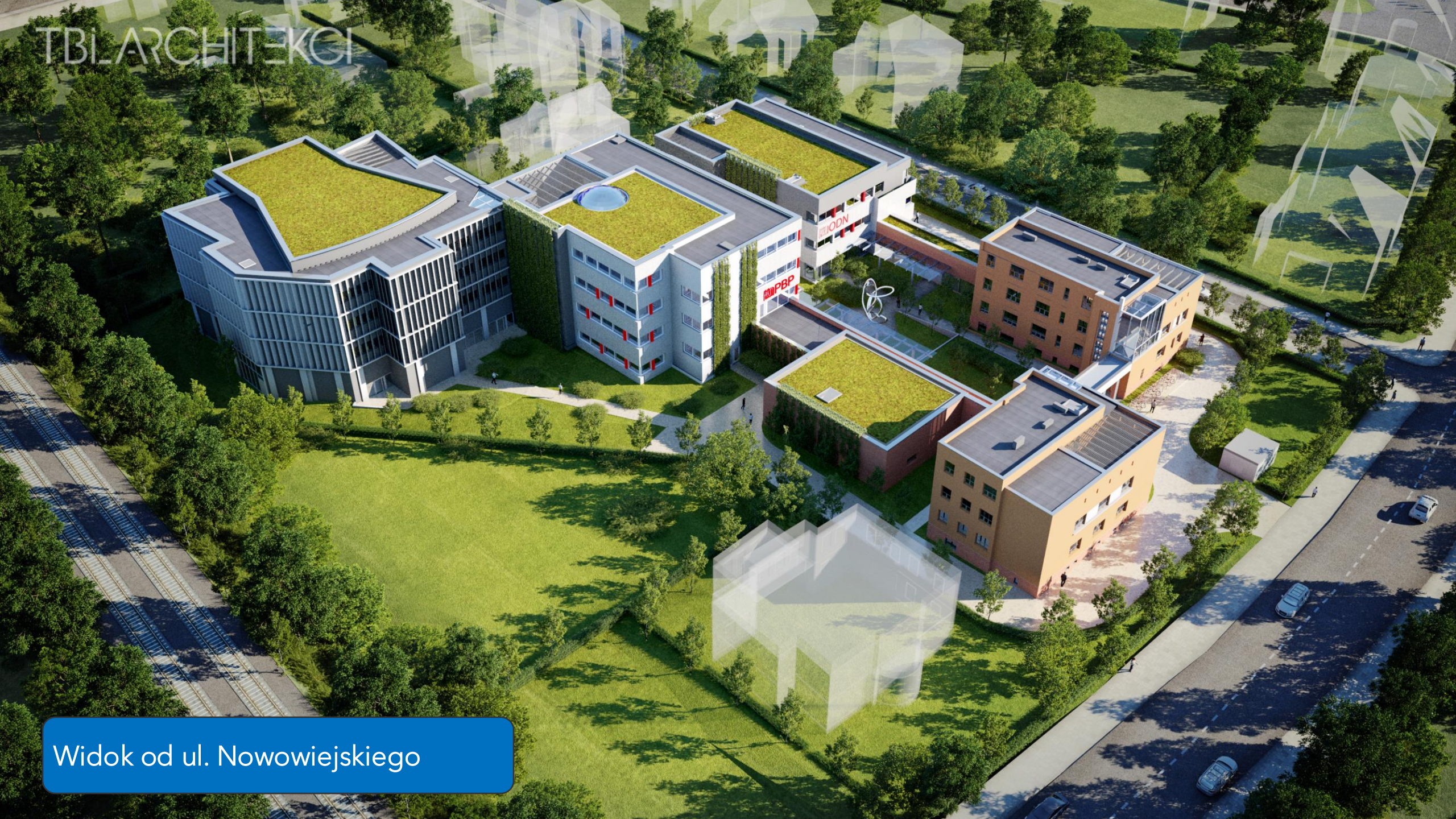
Widok od ul. Nowowiejskiego