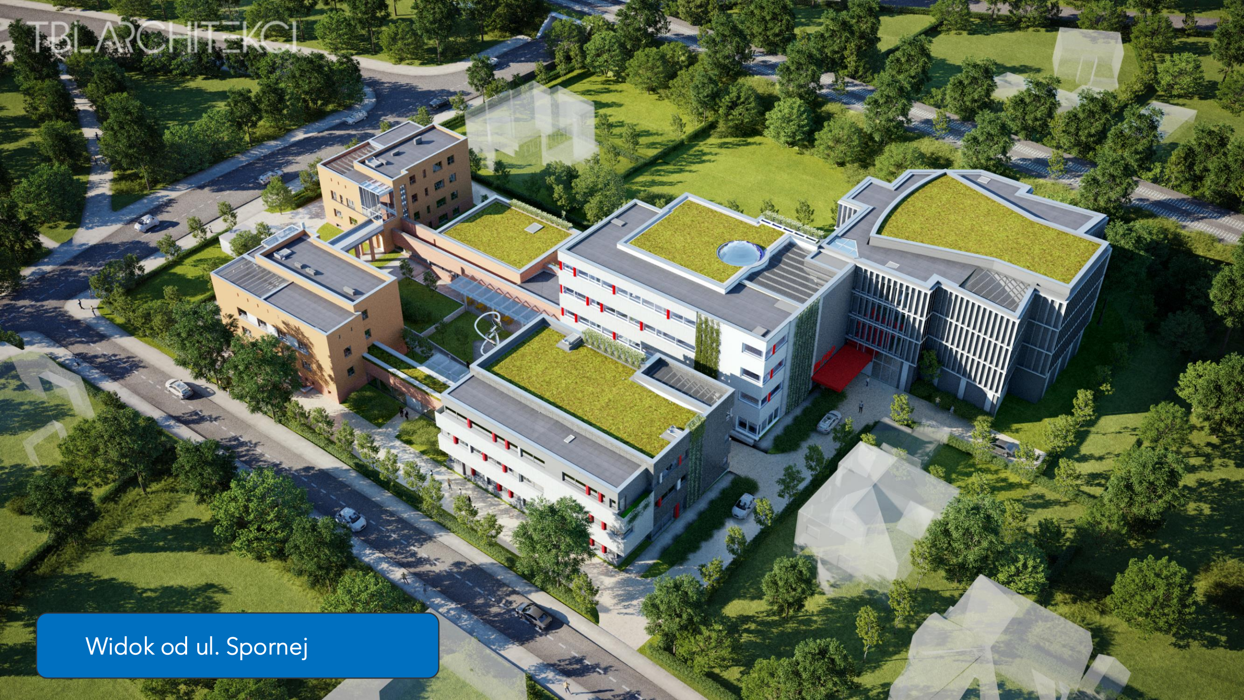
Widok od ul. Spornej