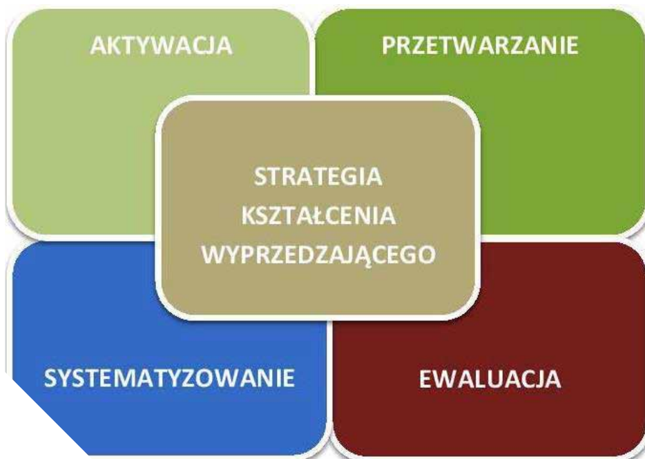
Model strategii kształcenia wyprzedzającego.

Tematyka scenariuszy wynika z celów głównych Projektu, uwzględnia