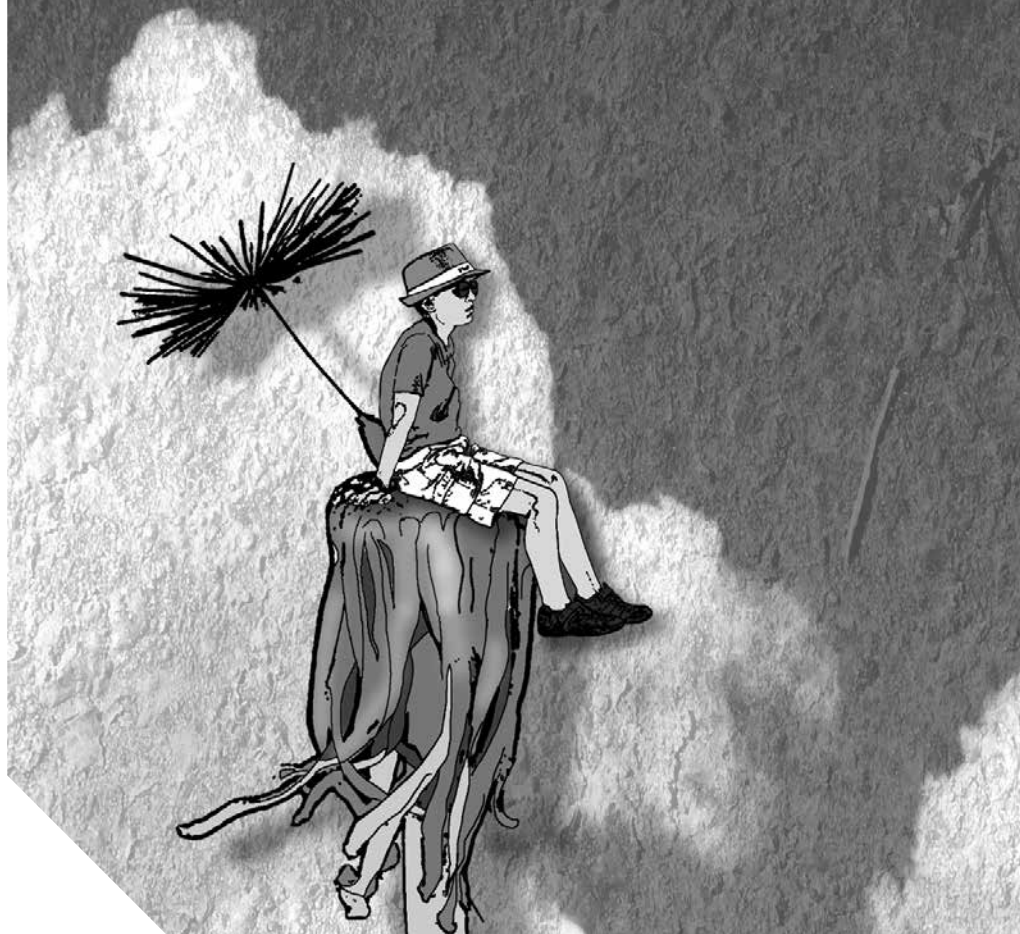
Ilustracja: Sylwia Pragłowska

Wielu terapeutów (w szczególności reprezentujących nurt psychologii poznawczej) podkreśla znaczenie myśli i przekonań w kształtowaniu reakcji na różne obciążenia i sytuacje stresowe. Kluczową kwestią okazuje się poczucie kontroli oraz sprawstwa. Psycholodzy poznawczy podkreślają, iż w dużym stopniu to od sposobu widzenia świata zależy zdolność do wpływania na okoliczności naszego życia. Nasze przekonania dotyczące nas samych oraz tego, jak postrzegamy świat, kształtują nasz obraz tego, co jest możliwe. Warto