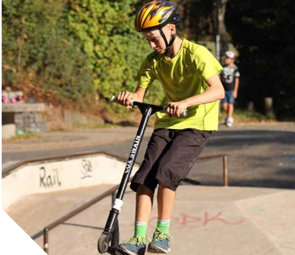
Uczniowie chętnie podjęli wyzwanie niecodziennej aktywności. Znaleźni się śmiałkowie, którzy podążyli za głosem szaleństwa.

// Łatwo oceniać czyjeś zmagania, ale sprostać wyzwaniu rzuconemu samemu sobie i przekroczyć własną granicę, to dopiero jest zadanie! Uczniowie mieli znaleźć aktywność, której jeszcze nie podejmowali, a pomysł skonsultowa z rodzicami.