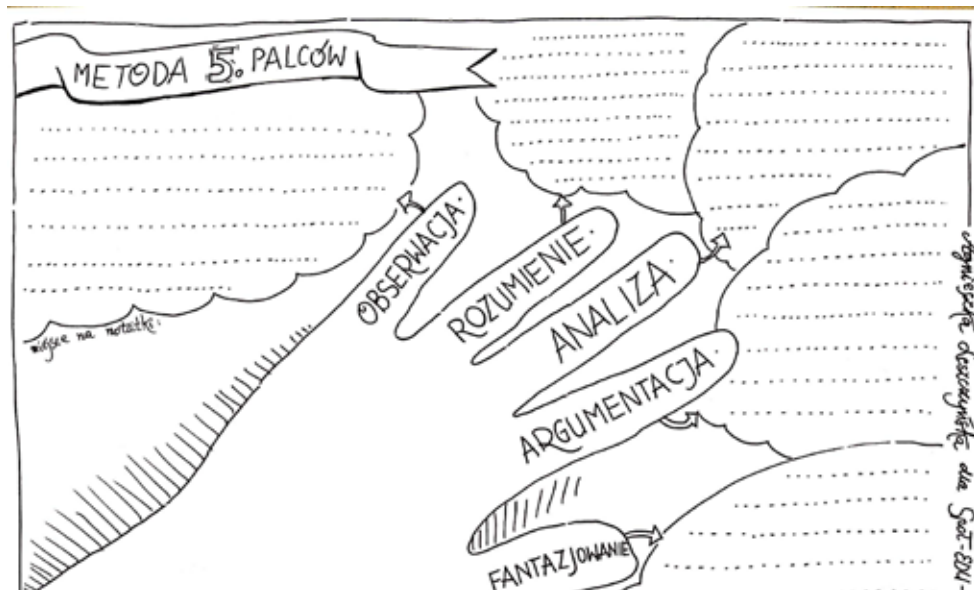
Metoda pięciu palców (obok drzewka decyzyjnego i rybiego szkieletu) została przygotowana w wersji online i do wydruku. Materiał został opatrzony komentarzem wyjaśniającym sposób wykorzystania narzędzi.

Założenie naszej pracy było następujące: pokazać, w jaki sposób konsumpcja wiąże się z kryzysem klimatycznym. Chodziło nam o to, by uczeń został postawiony w sytuacji wyboru, by wzbudzić jego emocje, zainspirować do zastanowienia, zachęcić do poszukiwania informacji, a później (być może) doprowadzić do zmiany zachowania. Przygotowaliśmy cztery bloki materiałów. Każdy z nich składał się z historii dylematycznej, materiałów dla nauczyciela oraz prezentacji do wykorzystania na zajęciach z uczniami. Opracowaliśmy historie dotyczące jedzenia, ubrań, plastiku i tworzyw sztucznych oraz polityki i pieniędzy. Jeden z bohaterów ma przejąć gospodarstwo rodziców. Problem polega jednak na tym, że nie chce kontynuować hodowli przemysłowej. Dwie dziewczyny związane są z modą: jedna to młoda projektantka z Europy, druga mieszka w Bangladeszu i marzy o tym, żeby szyć. Grupa przyjaciół ma opracować kampanię dotyczącą plastiku i jego wpływu na środowisko. Jednak ojciec jednego z bohaterów prowadzi firmę produkującą plastikowe gadżety. Co ma zrobić aktywistka biorąca udział w demonstracjach przeciwko uzależnieniu polskiej energetyki od węgla, gdy jej koledzy z klasy to dzieci górników?