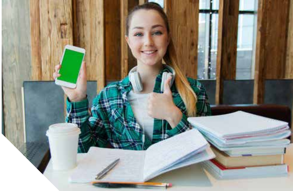
Warto zachęcać uczniów do nagrywania się przy użyciu dyktafonu i porównywania własnej produkcji z oryginałem.

Uczniowie powinni mieć świadomość, że poprawna wymowa ma fundamentalne znaczenie dla skutecznej komunikacji oraz posiada wartość społeczną – kreuje wizerunek rozmówcy w oczach słuchacza.