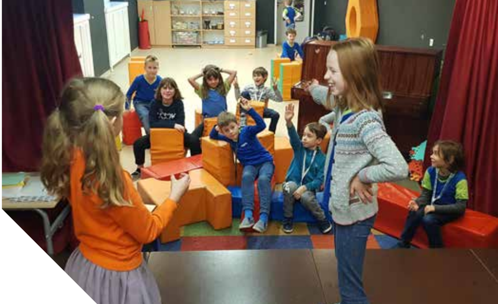
Improwizowanie da nam mnóstwo frajdy i okazji do serdecznego śmiechu, choć historie i scenki bywają nie tylko zabawne, ale i wzruszające, a czasem dramatyczne.

W impro porażka jest pożądana, można ją przekuć w osobisty i wspólny sukces. Jeśli popełniasz błąd, to znaczy, że podejmujesz działanie, nie unikasz odpowiedzialności, próbujesz wyjść poza własną strefę komfortu i dotychczasowe umiejętności. To ulga dla uczniów nieustannie poddawanych ocenie, pozostających w poczuciu bycia niedostatecznym,