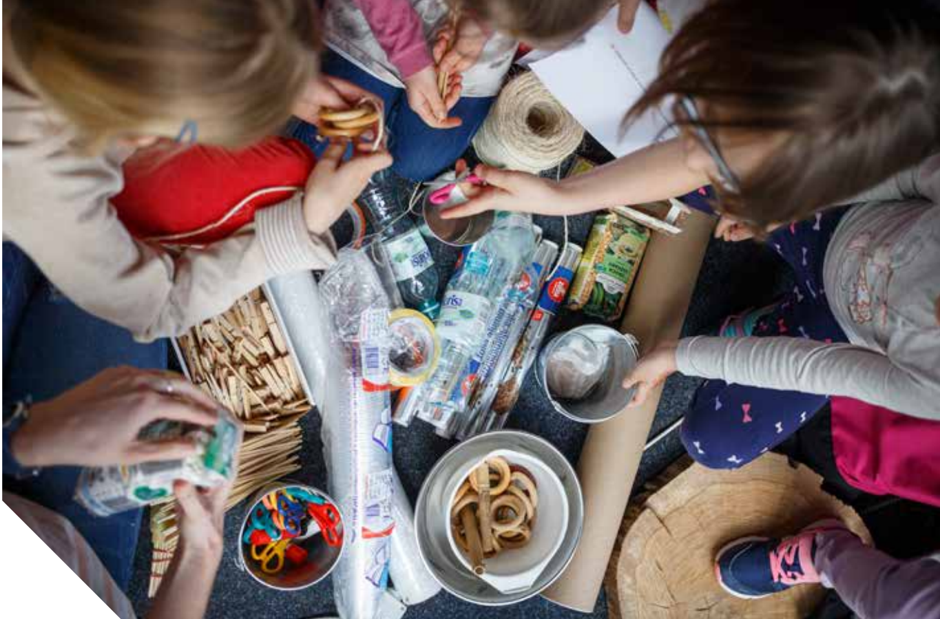
Warsztaty działań twórczych inspirowane spektaklami pogłębiają rozumienie jej sensu, są treningiem wyobraźni, kreatywności i świetnie integrują grupę.

W 2020 roku przygotowano wersje online sztuk nagrodzonych w 31. Konkursie na Sztukę Teatralną dla Dzieci i Młodzieży. Dostępne są na kanale YouTube do końca czerwca 2021 roku.