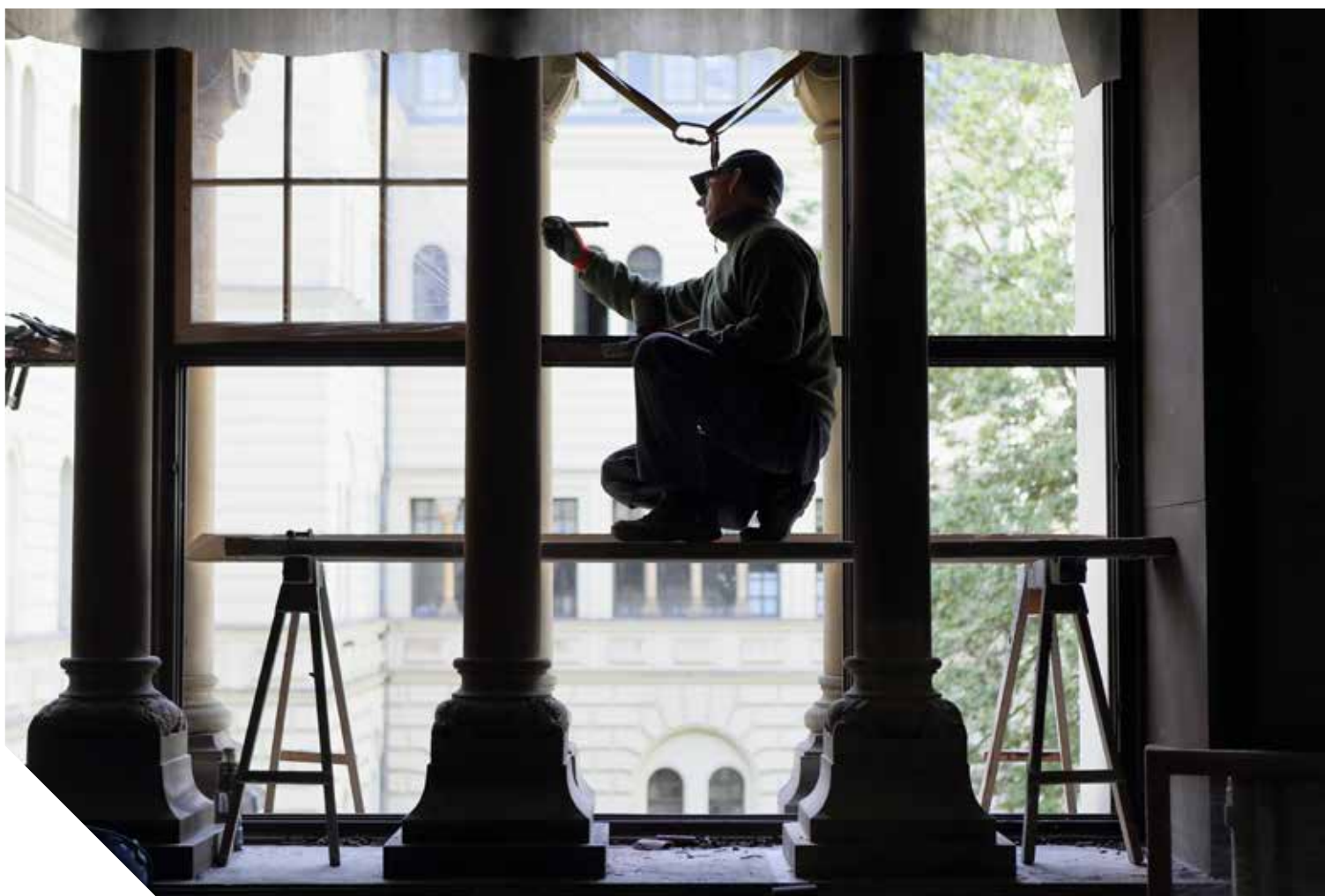
Prace konserwacyjne w Holu Kolumnowym Zamku

By dowiedzieć się więcej o możliwościach poznania Zamkowych historii, prosimy odwiedzać naszą stronę internetową: www.ckzamek.pl