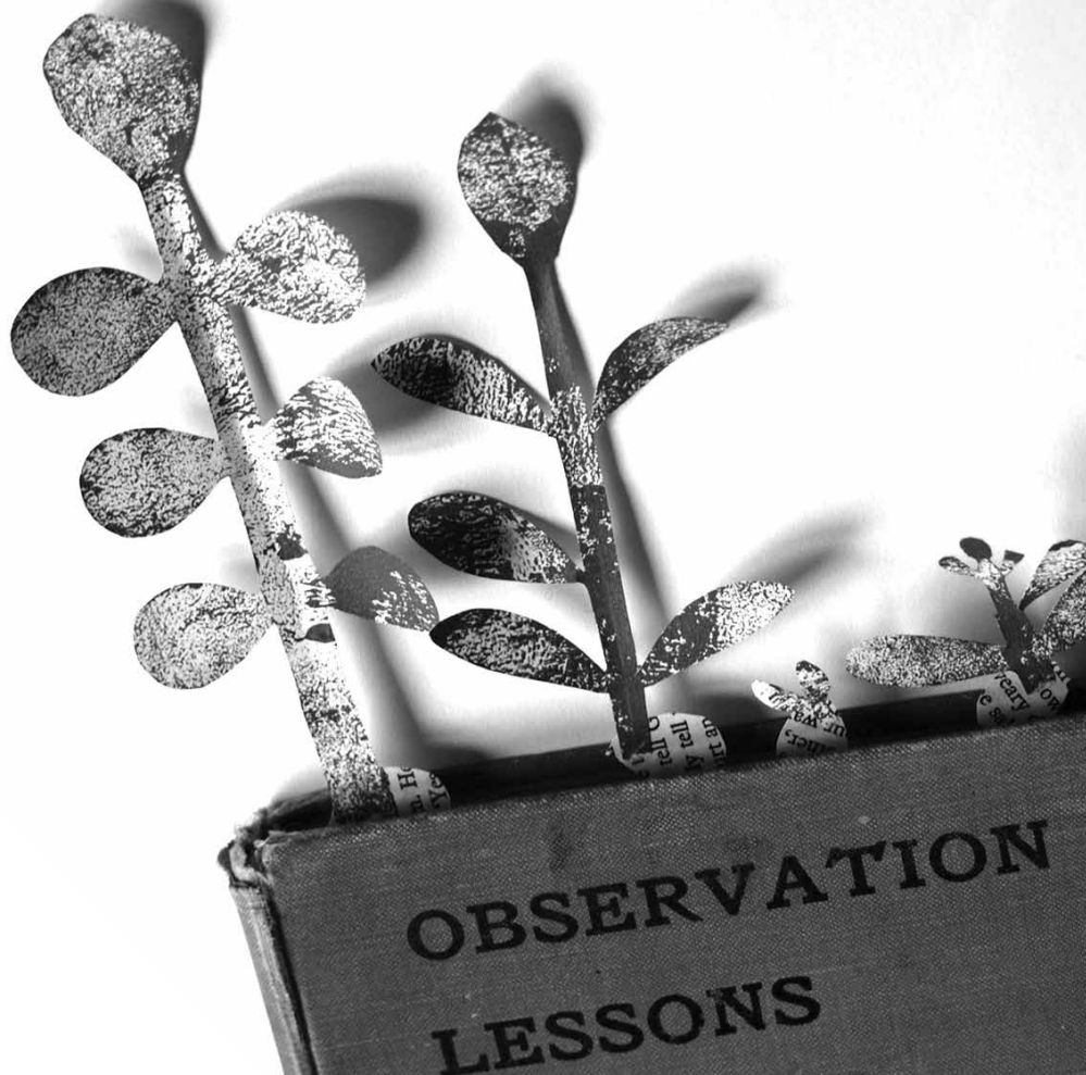
Ilustracja: Sylwia Pragłowska

Wydana w dużym formacie i pięknie ilustrowana książka Ratujmy zwierzęta uświadamia, że troska o ekologię jest równoznaczna z troską o życie wielu gatunków zwierząt, których istnienie jest zagrożone. To źródło wiedzy na temat powszechnie znanych (np. niedźwiedź polarny) oraz unikalnych zwierząt (np. ambystoma meksykańska).